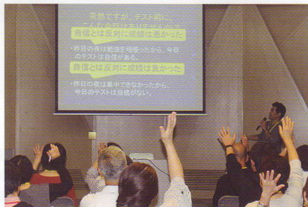
実践の講話を想定してのフォローアップ講座

宮崎県では、乳幼児や青少年を取り巻くメディア利用の現状、危険性や対処法などを県内各地域において講演や講話をする「宮崎県メディア安全指導員」の養成と活用を図っています。講習を受けてメディア安全指導員として認定された方々が、子どものメディア（テレビ・スマホ・ゲーム・インターネット等）との接触の現状、問題点や具体的な対応策などを、子どもの育ちに関わる様々な会合や研修会、授業等で講演や講話を行います。詳しくは、宮崎県庁・宮崎県青少年育成県民会議のホームページをご確認ください。