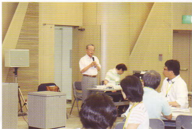
NPO 法人「子どもとメディア」代表理事の講話