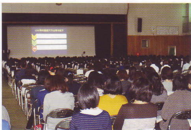
小林高校での生徒・保護者・教職員を対象とした講演

宮崎県では、乳幼児や青少年を取り巻くメディア利用の現状、危険性や対処法などを県内各地域において講演や講話をする「宮崎県メディア安全指導員」の養成と活用を図っています。講習を受けてメディア安全指導員として認定された方々が、子どものメディア（テレビ・スマホ・ゲーム・インターネット等）との接触の現状、問題点や具体的な対応策などを、子どもの育ちに関わる様々な会合や研修会、授業等で講演や講話を行います。詳しくは、宮崎県庁・宮崎県青少年育成県民会議のホームページをご確認ください。