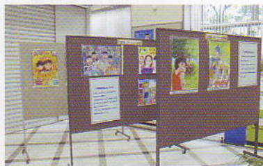
宮崎銀行宮崎支店