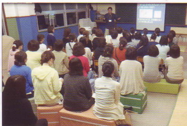
延岡市内の保育園の保育士を対象とした講演