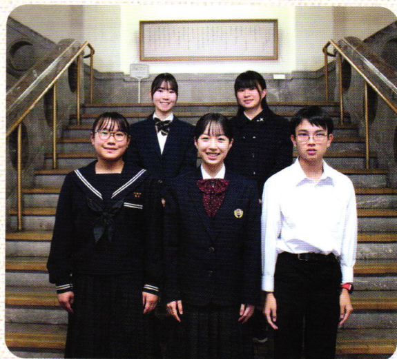
発表者のみなさん